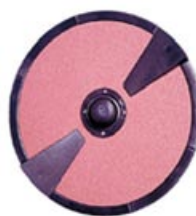
piattello abrasivo per patate abrasive plate for potatoes tournette abrasive pour pommes de terre plato abrasivo para patatas