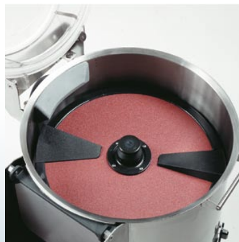
pelapatate P5 aperto potatopeeler P5**open eplucheur pommes de terre P5 ouvert peladora de patatas P5 abierta