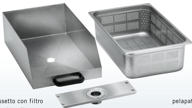
cassetto con filtro cartridge filter tiroir avec filtre cajon con filtro