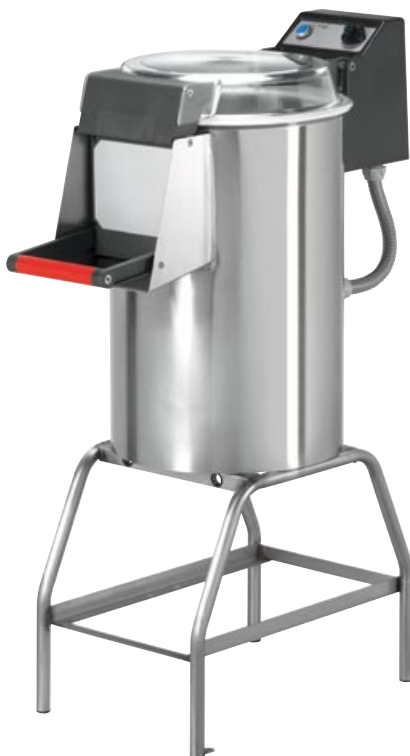
P 10 con cavalletto inox with stainless steel stand avec support en acier Inox con soporte en acero Inox