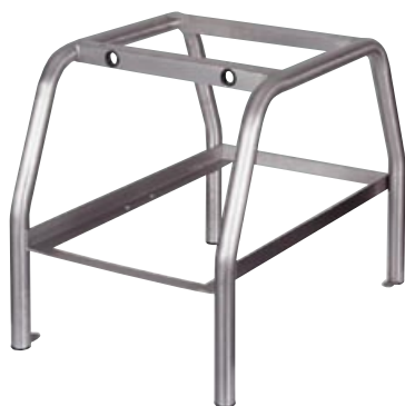
cavalletto*** stand untergestell caballete